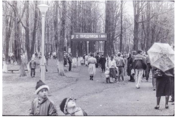
Рисунок 1 – Парк в г. Спас-Деменск в прошлом веке

Преобразованием парка занимались неоднократно, всегда вносили что-то новое. Размещали площадки для спорта, устанавливали карусели, качели. Было даже маленькое местное колесо обозрения.