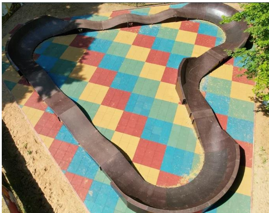
Рисунок 5 – Памп-трек в Спас-Деменске

Последнее время популярно стало устанавливать на общественных пространствах в муниципалитетах оборудование для экстремальных видов спортивных активностей. В 2022 году специалисты компании SKpark завершили установку памп-трека, площадь которого составила почти 300 квадратных метров. Он представляет собой закольцованную трассу длиной 50 метров, на которой чередуются ямы, кочки и контруклоны (рисунок 5). Спортивная площадка с двух сторон отделена металлическим красочным ограждением с фотопечатью [4].