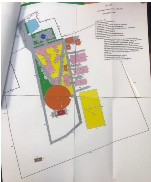
Рисунок 3 – Схема планировочной организации земельного участка городского парка

Территория рассматриваемого участка располагается за пределами водоохранных зон. Отсутствуют вблизи участка особо охраняемые природные территории и объекты.