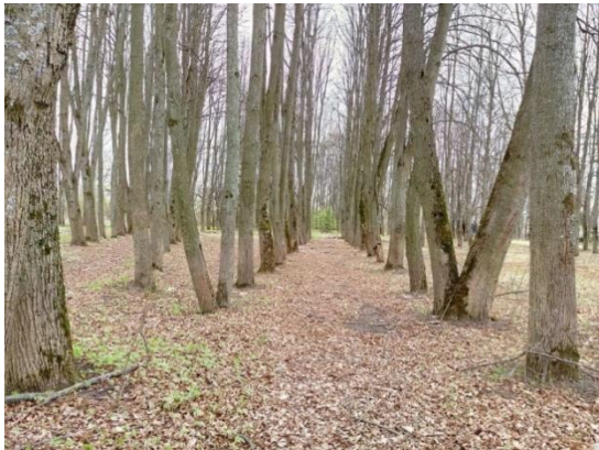
Рисунок 2 – «Забывтый» парк в конце 20-го начале 21-го вв.

С приходом 90-х годов двадцатого века парк потерял свою востребованность. Население города вынуждено было «выживать». Парк оказался заброшенным и постепенно приходил в упадок. Руководство города длительное время не знало, как исправить ситуацию (рисунок 2) [1].