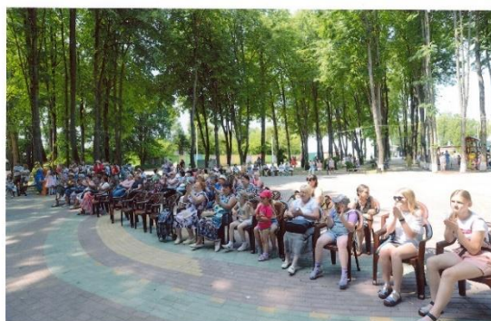
Рисунок 3 – Отремонтирована сцена, установлены скамейки для зрителей

Третий этап (2019 год) - построен тир, автодром для детских машин, веревочный парк, благоустроена центральная часть парка (рисунок 4).