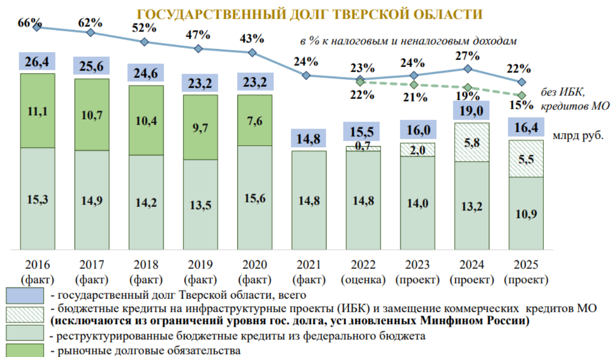
Рисунок 2. Динамика и прогноз состояния государственного долга Тверской области в 2016-2025 гг. [6]

До 2020 г. структура государственного долга региона включала рыночные долговые обязательства, снижающиеся с 11,1 млрд. руб. в 2016 г. до 7,6 млрд. руб. в 2020 г., и реструктурированные бюджетные кредиты, уровень которых в течение 2016-2020 гг. не превышал 16 млрд. руб. Со снижением уровня государственного долга региона с 26,4 млрд. руб. в 2016 до 14,8 млрд. руб. в 2021 г. происходит и снижение долговой нагрузки, с 66% в 2016 г. до 22% в 2022 г. (оценка). Реструктуризация государственного долга позволяет высвободить средства, которые регион сможет использовать для развития.