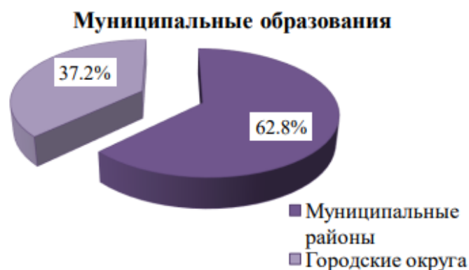
Рисунок 2 – Муниципальные образования Челябинской области 2

Для более детального разбора проблематики профилактики рисков предсказуемости, прозрачности, стабильности финансирования муниципальных образований для примера был выбран регион – Челябинская область. В состав Челябинской области входит 43 муниципальных образования, в т.ч. 16 городских округа, 27 муниципальных районов (рисунок 2).