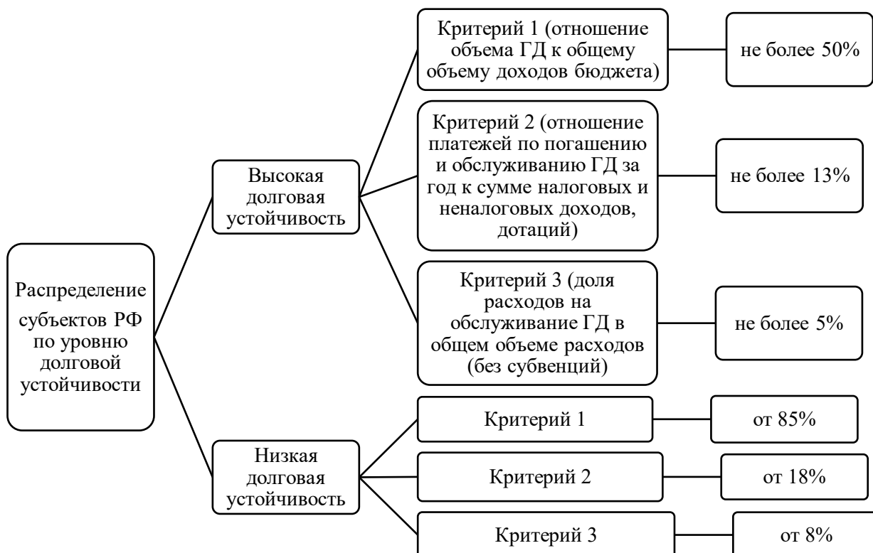
Рисунок 3. Распределение субъектов РФ по уровню долговой устойчивости (ст. 107.1 БК РФ)

Таким образом, в настоящее время в нормах бюджетного законодательства критериями долговой устойчивости регионов выступают: долговая нагрузка (К1), текущая долговая нагрузка (К2), обслуживание регионального долга (К3).