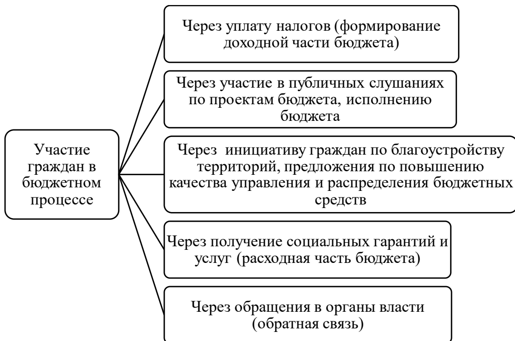
Рисунок 1 – Формы участия граждан в бюджетном процессе

Кроме того, полагаем, что возможный алгоритм участия граждан в бюджетном процессе должен выглядеть следующим образом (рис. 2.).