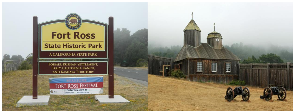
Рисунок 2 – Русская крепость Росс в округе Сонома, штат Калифорния

Прямые продажи в розничной и оптовой торговле больше увеличиваются при реконструкции исторического здания, чем при строительстве нового объекта. В Калифорнии, например, средства, инвестированные в восстановление исторических объектов, увеличили заработки в оптовой торговле на 10%, а в рознице на 43% больше, чем в новостройках.