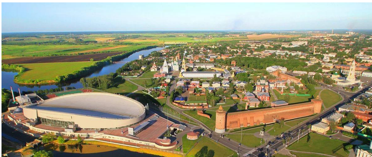
Рисунок 1 – МБУ «Конькобежный центр «Коломна», г. Коломна

Именно это и называется «культурная катастрофа» , когда города, пережившие революции и войны, превращаются в спальные панельные районы, а особняки довоенного периода сносятся очередными «Пятёрочками» и парковками. Пример этому, который я буквально недавно увидела, приехав в Коломну – огромный панельный конькобежный центр в панораме Коломенского кремля.